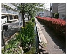
街なかのせせらぎ