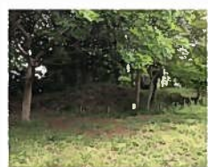
市内に現存する唯一の前方後円墳