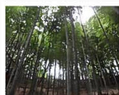
里山の竹林も特別に開放されます