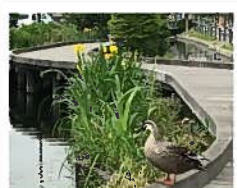
いろいろな動植物も見られます